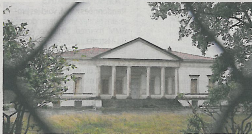
Une école de mode est proposée dans le cadre de l'appel à projets de la villa Fal.